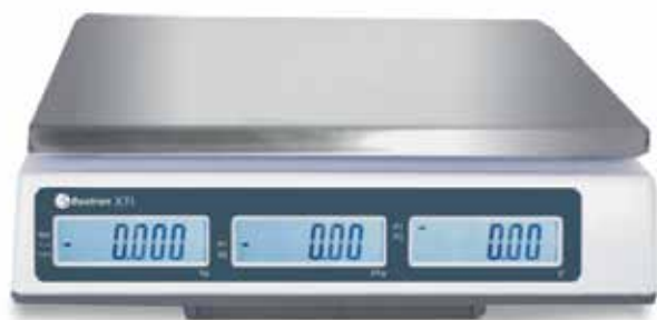
Três ecrãs comprador retroiluminadas